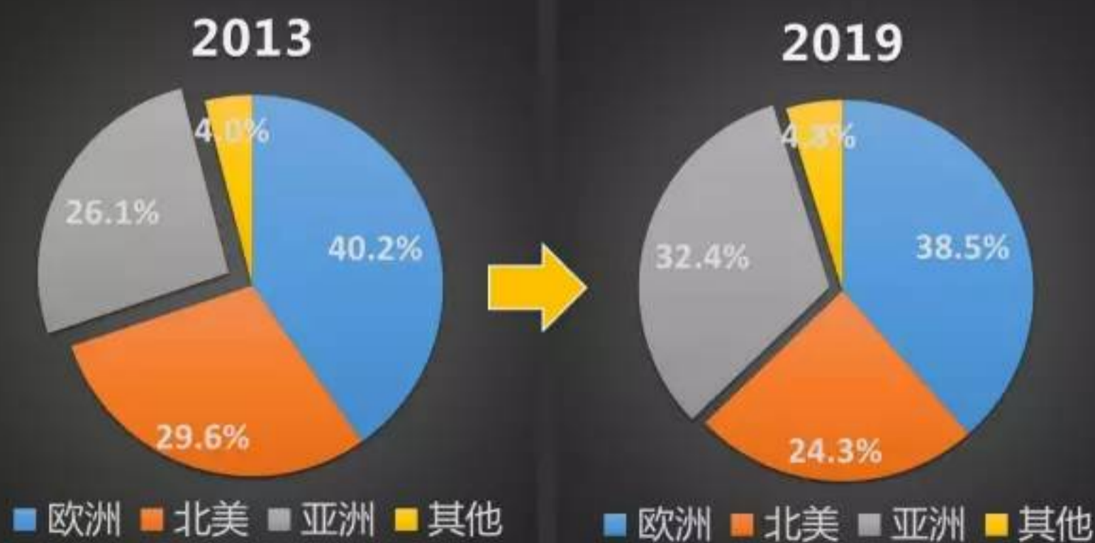
生物降解塑料消费地区细分