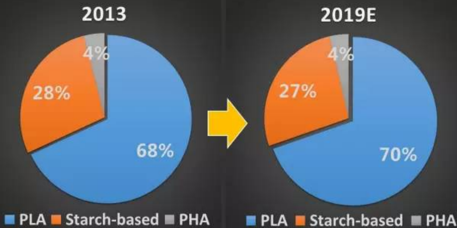
生物降解塑料细分市场（2013和2019E）