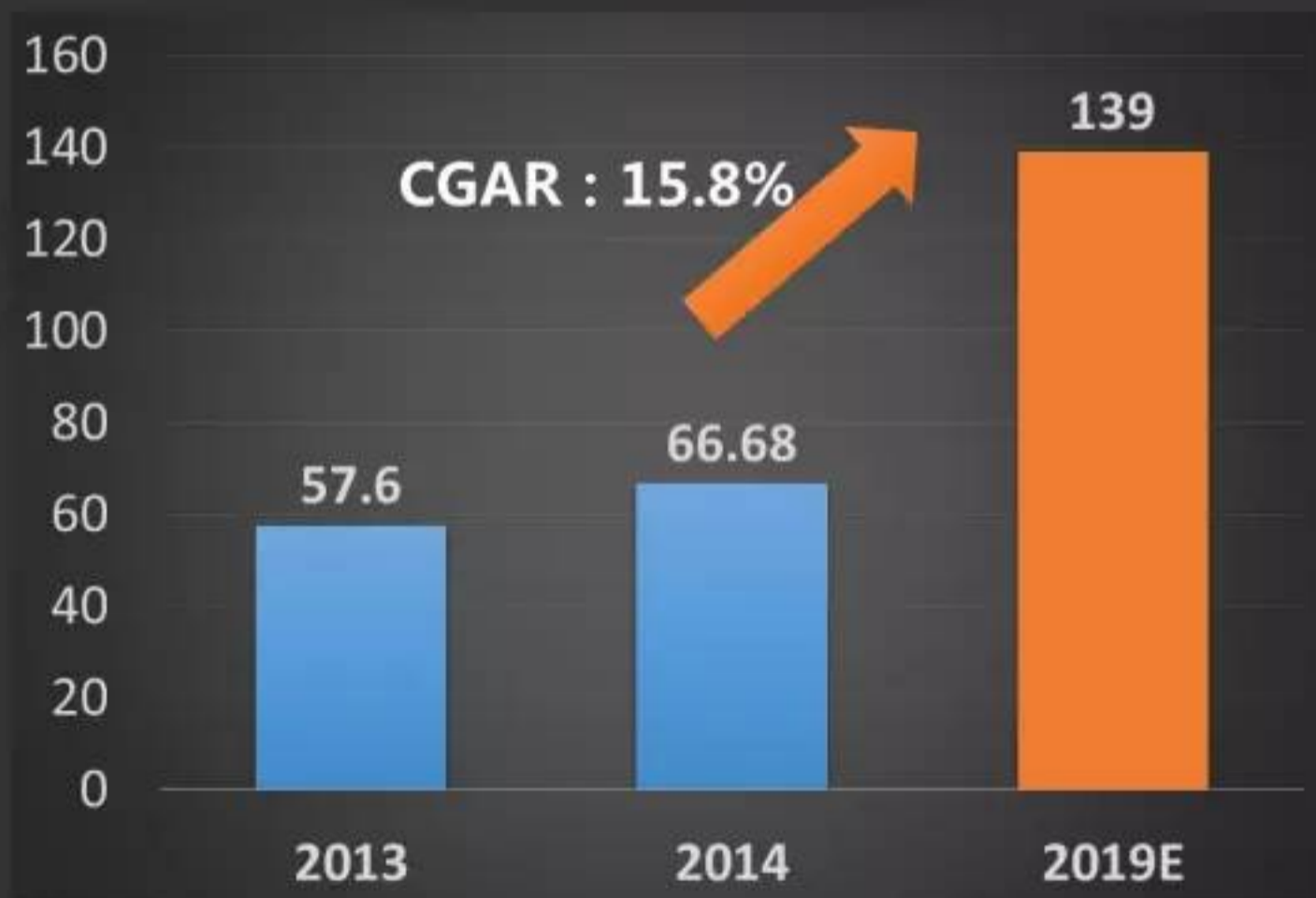
生物降解塑料市场（单位：万吨）